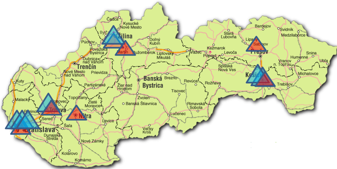
Obrázok 2 Teritoriálne rozloženie podporených projektov UVP a VC