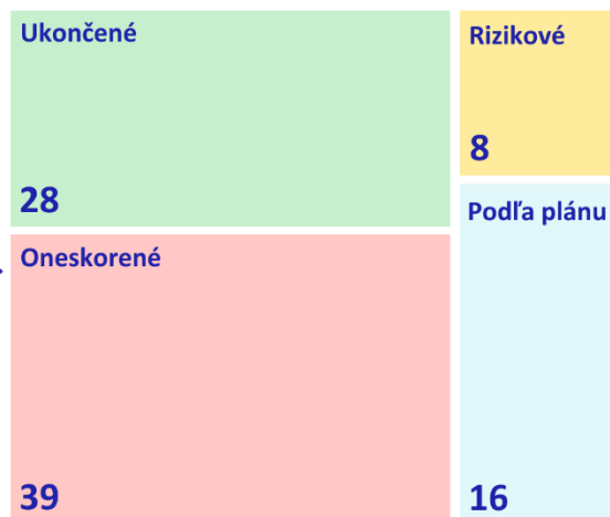
Tabuľka 1: Prehľad opatrení Národnej stratégie podľa stavu implementácie a hlavného gestora.